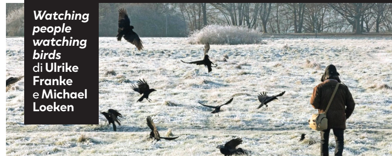
Watching people watching birds di Ulrike Franke e Michael Loeken