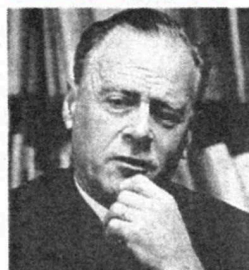
Il sociologo Marshall McLuhan e, nella foto sopra, Clint Eastwood