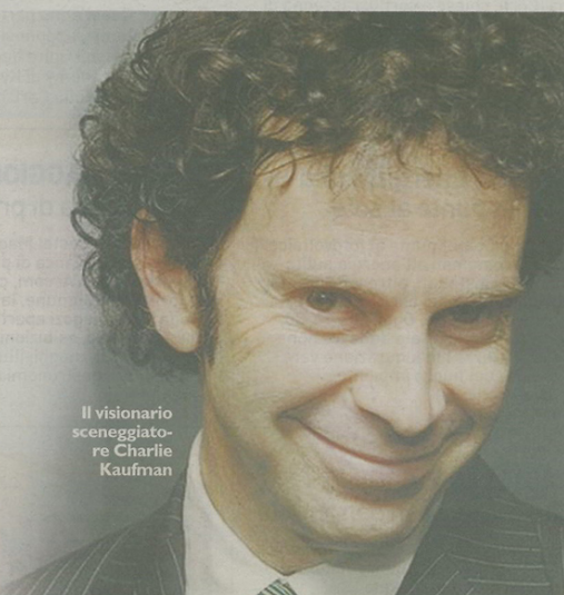
Il visionario sceneggiatore Charlie Kaufman

visitazione dell'Italia del boom, gli anni '60, la dolce vita — a MAMbo, è in corso la mostra dedicata proprio a Federico Fellini —, la Roma del Piper. Ma l'inizio, come ha spiegato alla prima presentazione di ieri, nella Cappella Farnese di Palazzo d'Accursio, lo stesso Romeo, sarà nel segno della coscienza dell'ambiente e degli attentati che esso patisce. «Apriremo con The Cove , il documentario action di Louie Psihoyos, premio Oscar di quest'anno, sulla mattanza dei delfini nei mari giapponesi. E lo stesso giorno — ha aggiunto il direttore — il pubblico potrà dialogare via Skype con i fondatori di Greenpeace, protagonisti di The Rainbow Warriors of Waiteke Island , di Suzanne Raes, uno dei